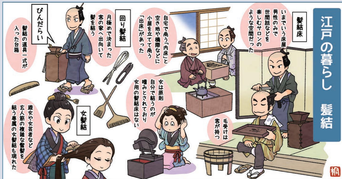
イラスト：桐丸ゆい

編集発行 小野寺燃料株式会社 オーナーサポート室 〒063-0850 札幌市西区八軒10条西3丁目4-30 TEL (011) 612-8080 FAX (011) 612-2233